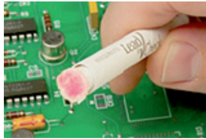
鉛1%に反応して先がピンクに変色