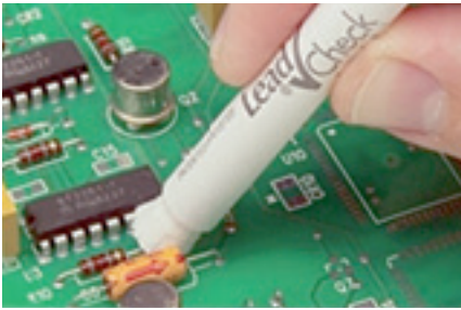
確認部分をチェッカーの先で擦る