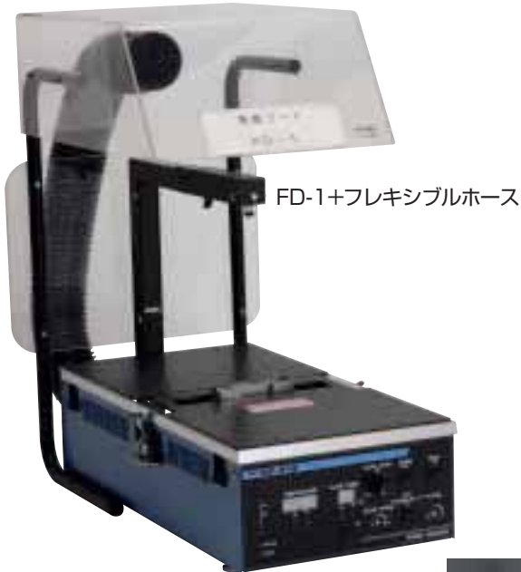
FD-1+フレキシブルホース